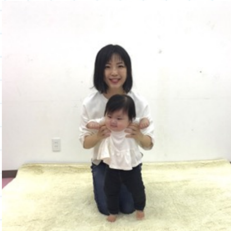
①赤ちゃんの脇を抱えて、お母さんの膝の上で立たせる。