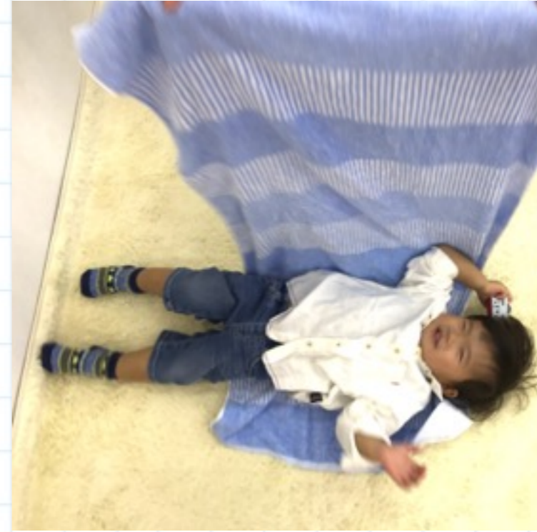
②そのままゆっくりとタオルを引きゴロリンと転がす。