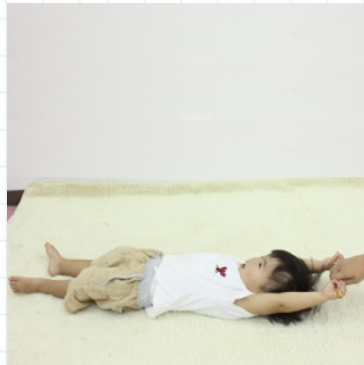
②棒をしっかりとにぎらせ、赤ちゃんの手を伸ばした状態でお母さんが棒をゆっくりとひっぱる。