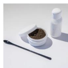
実験キット (泥&消石灰) ¥500 (税込)