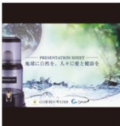
新規説明資料 [2025年7月 ～～～]