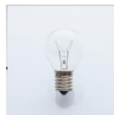
電気の実験セット