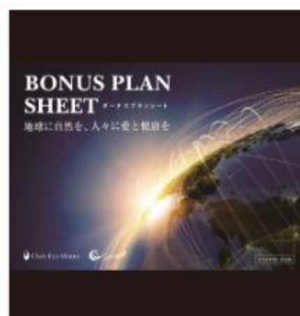
ボーナスプランシート ～～～