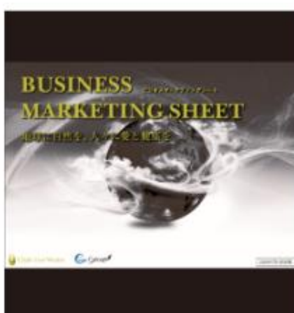
ビジネスマーケティング ～～～